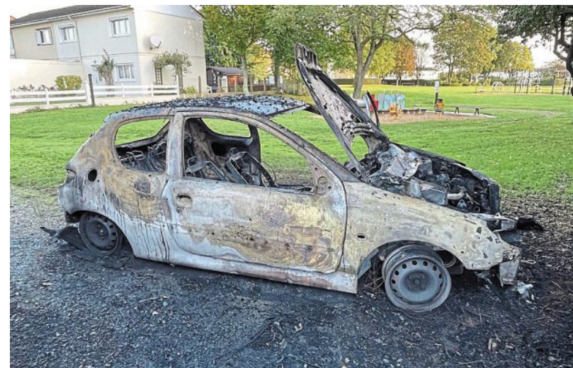
Une voiture a été incendiée dans le parc située allée Jacques-Cartier, dans le quartier de Courteille, hier.

Les sapeurs-pompiers sont intervenus tôt, hier matin, dans le quartier de Courteille. Une voiture a été détruite dans un incendie.