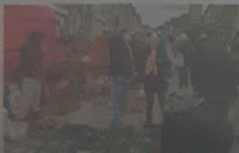
On fait de bonnes affaires.