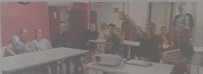
Mercredi 21 mars, une réunion s'est tenue afin d'expliquer aux participants les contours de l'évènement, sous forme de séjour à Paris.

Le Foyer d'Hébergement (FH) Anais de Domfront-en-Poirais compte parmi les établissements participant à ce projet sportif et collectif, bien décidé à démontrer que le sport n'exclut pas le