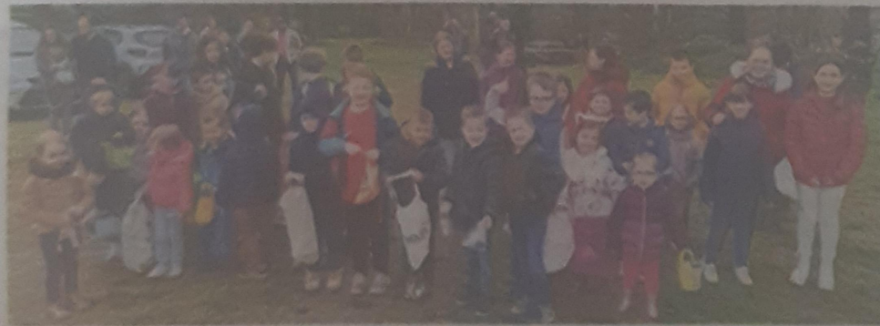
Une cinquantaine d'enfants pour la chasse aux œufs.

Les différentes animations de la fête de Pâques ont attiré beaucoup de monde dans la commune.