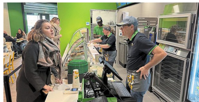
Le Subway, installé dans la galerie commerciale Carrefour de Condé-sur-Sarthe, accueille les premiers clients.

Après des incertitudes autour de la date de lancement, le premier Subway de l'Orne est bien ouvert ! L'enseigne américaine de sandwicherie est accessible depuis jeudi dans la galerie du centre commercial Carrefour de Condé-sur-Sarthe.