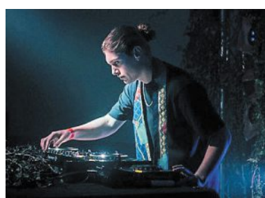
Hder sera présent au festival Cosmo.