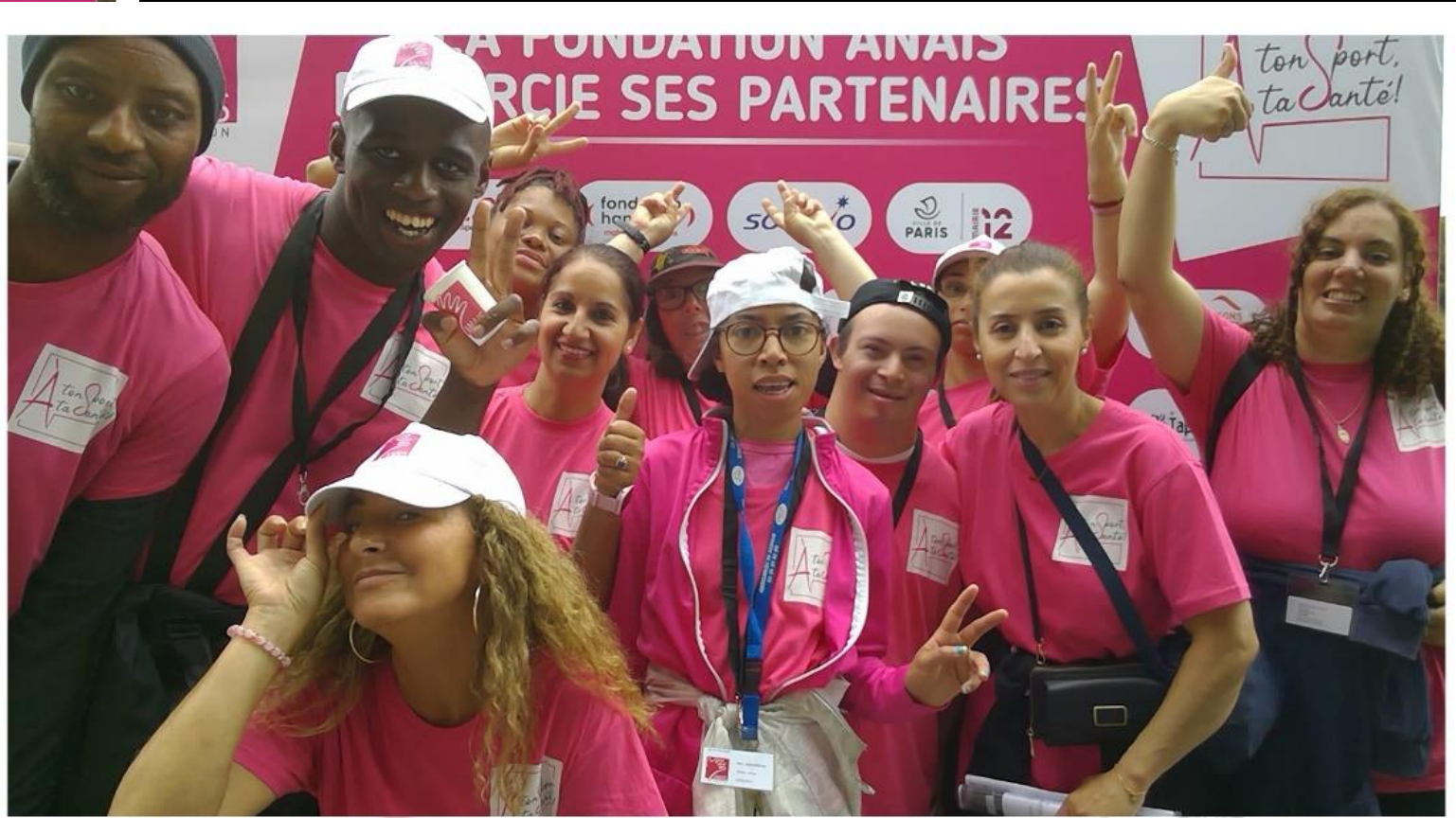
Jeudi 22 juin 2023 À ton tour