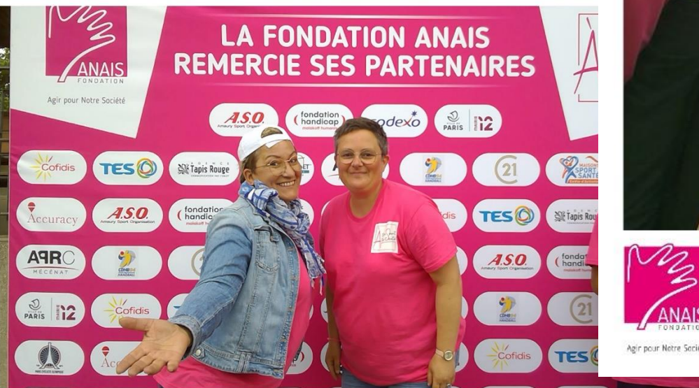
Jeudi 22 juin 2023 À ton tour