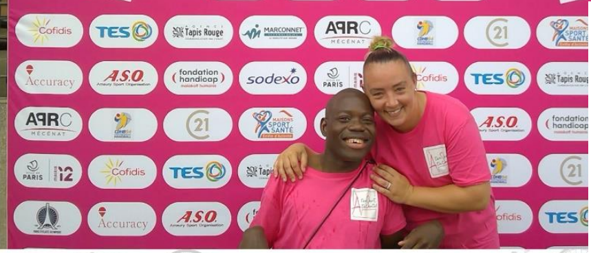
Jeudi 22 juin 2023 À ton tour